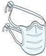
Máscara Cirúrgica (profissional)