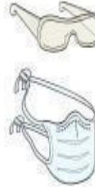
Óculos e Máscara