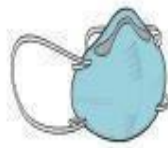
Máscara PFF2 (N-95) (profissional)