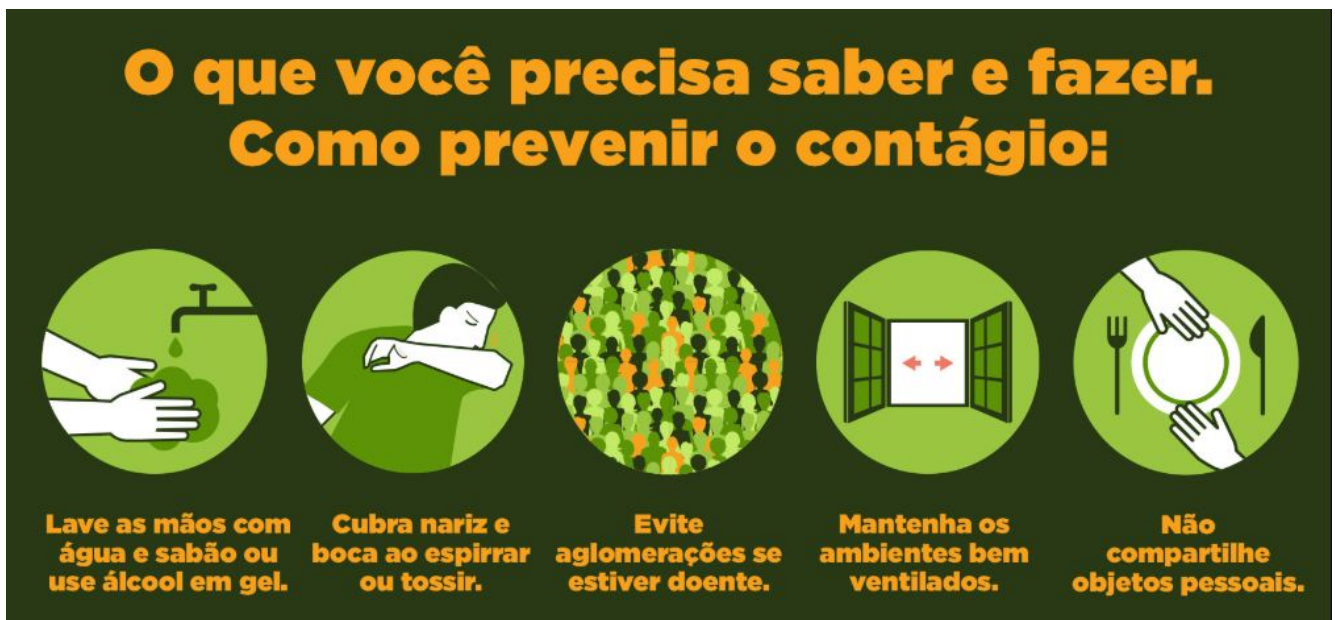
Figura 3: Orientações de prevenção ao COVID-19

O Ministério da Saúde lançou, no dia 28 de fevereiro, a campanha publicitária de prevenção ao coronavírus que já começou a ser veiculada em TV aberta, rádio e internet. As peças publicitárias (Figura 3) orientam a população a prevenir a doença adotando hábitos de higiene, como lavar as mãos com água e sabão várias vezes ao dia, fazer uso do álcool em gel a 70% e não compartilhar objetos de uso pessoal.